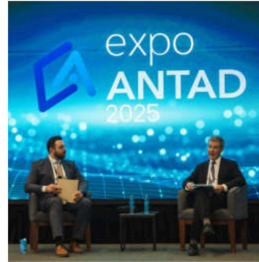
1 Expo talk: Taste the Future of Europe (27 May - 90min) Featuring EU producers taking part in the HLM