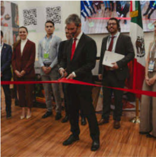
Opening ceremony with EU DEL, DG AGRI and EU MS