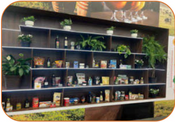
EU Product wall