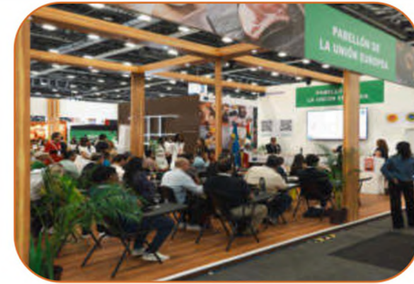
Area for cooking shows, product & food pairing sessions, and educational quiz