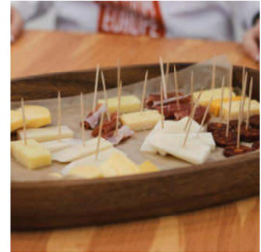
2 Quiz and 2 Happy Hour