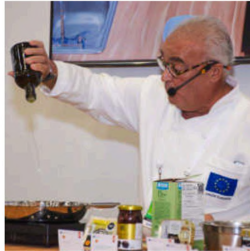
10 cooking shows and 7 products sessions – focus on GIs and organics