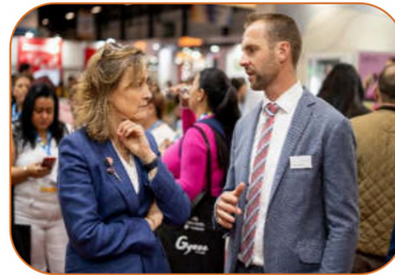
Area for Business Delegates to network