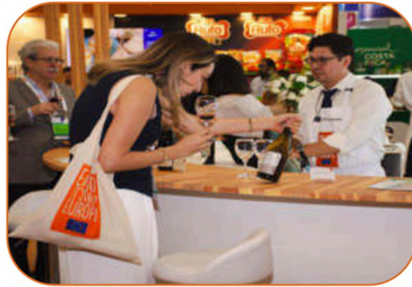
5 food tasting stations + bar